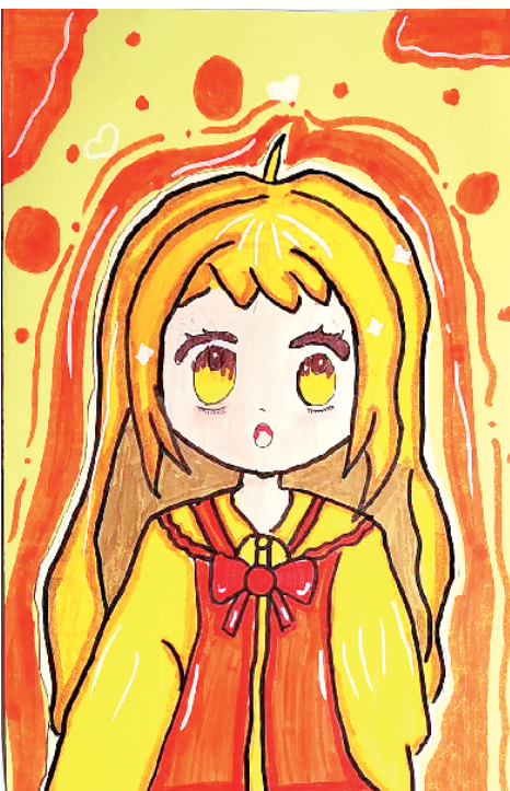
小记者:王诗涵 二(10)班 辅导老师:杨慧娟